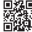
気象庁 HP より引用